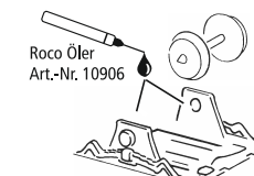
Roco Öler Art.-Nr. 10906

Ca. alle 30 Betriebsstunden! • I.e. after it has been in operation for 30 hours! • Environ tous les 30 heures d'exploitation! • Na elke 30 diensturen!